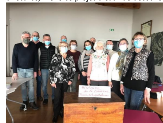
Une partie du groupe histoire